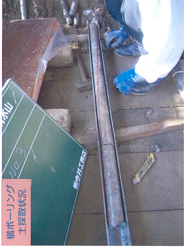
横ボーリング 土採取状況