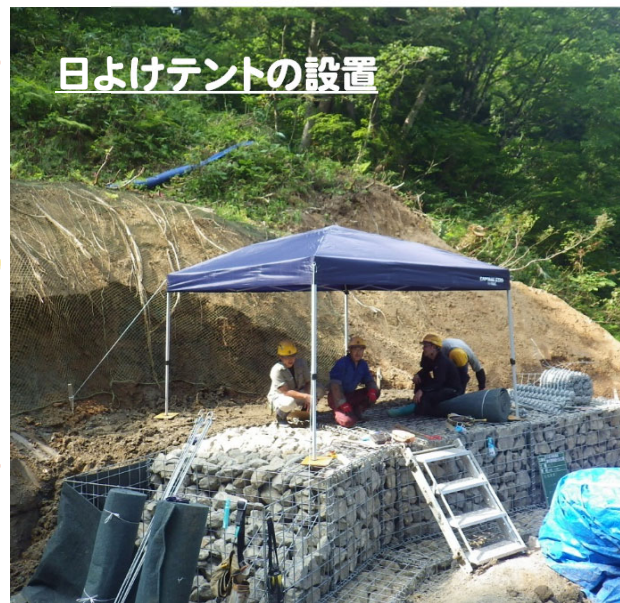
日よけテントの設置